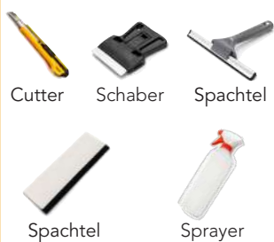
Cutter Schaber Spachtel